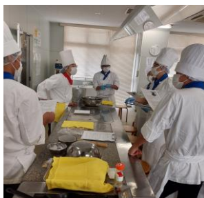
学生たちと打合せ中…

夏休み中で通常の授業はありませんが、学校紹介及び学生募集のためのイベントをたくさん開催しています。まずは 18 日のオープンキャンパスの状況です。メニューを全部紹介すると「ふわとろ玉子のオムライス」「レアチーズケーキ」「コンソメスープ」「野菜のサラダ」です。体験するのはオムライスとケーキです。オムレツをフライパンで作るのは練習が必要です。苦勞しながらも楽しく作ることができました。今回は調理師科から 6 名の学生たちが手伝ってくれました。