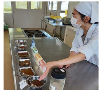
寒天・ゼラチンなどの説明